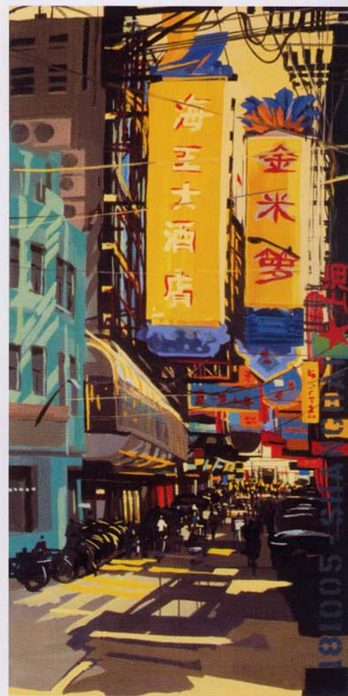
Michèle Auboiron, Zhapu Lu . 2005. Acrylique sur toile, 150 x 75 cm. D.R.

Pour les aventuriers des points de vue, grimper est la solution. Certains louent des chambres d'hôtel situées au dernier étage d'un immeuble. Des explications plus ou moins avouées de « peinture en chambre » à la réception peuvent favoriser la réclamation d'une autre chambre au même étage pour des raisons de changement d'orientation. Une ville vue d'en haut est le prétexte à des dessins et des couleurs différentes, des perspectives plongeantes très convaincantes. Un clocher, un étage d'immeuble d'habitation