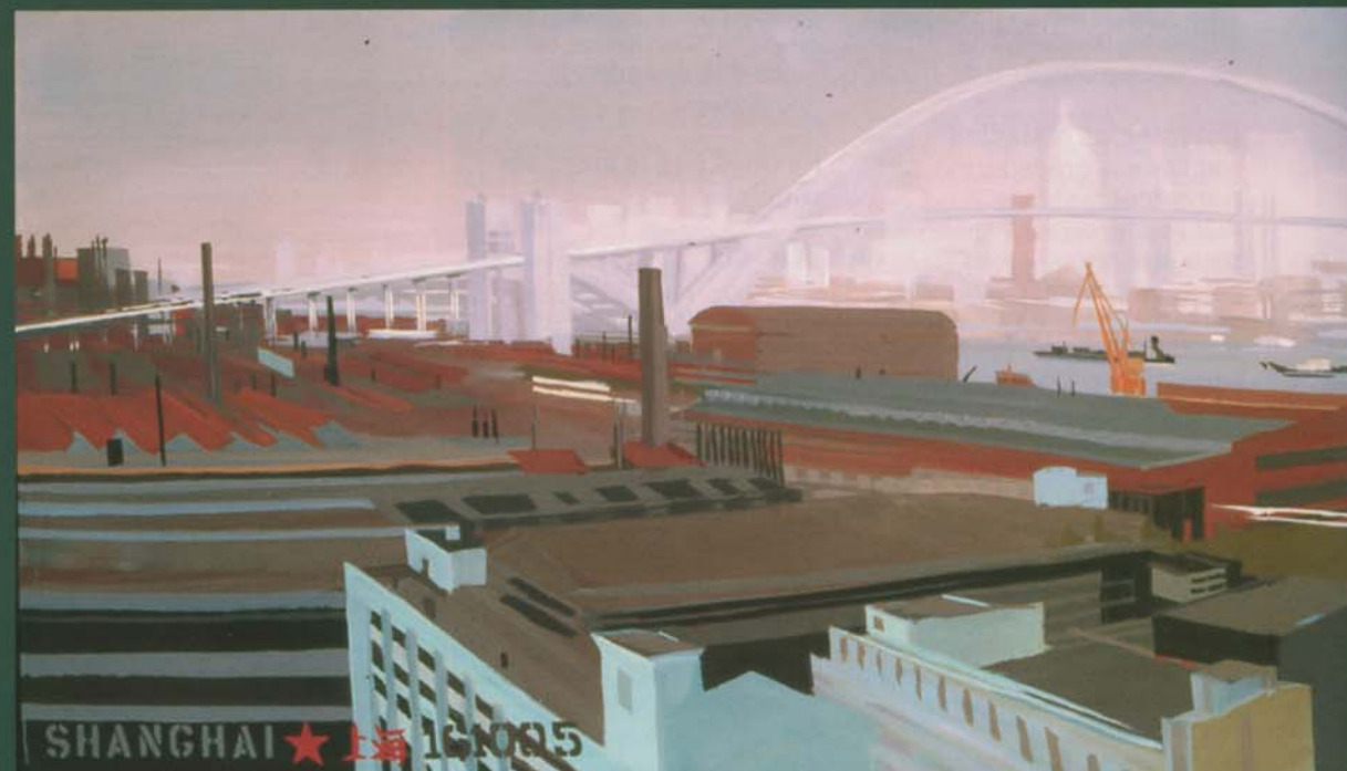
Sur le site de l'Exposition universelle de 2010 Acrylique sur toile - 300x120 cm - 2005