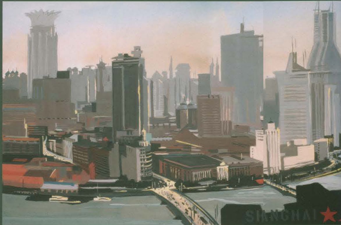
Puxi et Suzhou Creek - Vue du studio Acrylique sur toile - 200x100 cm - 2005