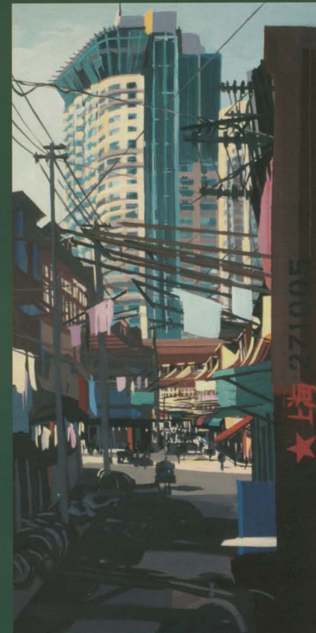
Le Heng Sheng Peninsula Acrylique sur toile - 75 x 150 cm - 2005