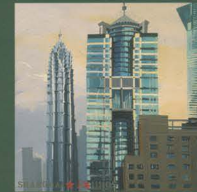
La Jinmao et la tour fluo Acrylique sur toile - 150x150 cm - 2005