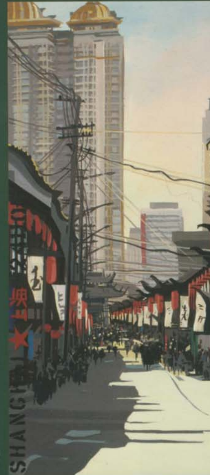
Puxi - Fangbang Lu Acrylique sur toile - 75x150 cm - 2005